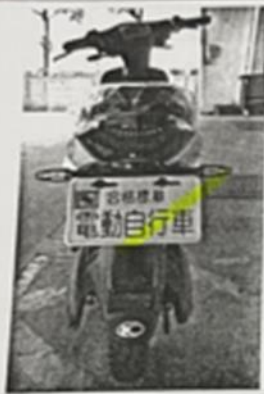
合格標章局部照片