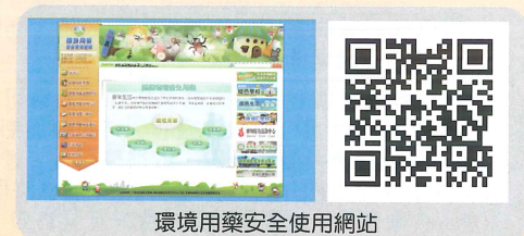
環境用藥安全使用網站