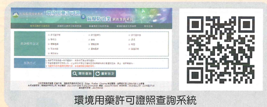
環境用藥許可證照查詢系統

環保署化學局已建置「環境用藥許可證照查詢系統」( http://mdc.epa.gov.tw/MDC/search/search_License.aspx )，只要鍵入產品名稱或許可證字號，即可查詢所選購的環境用藥是否合法登記。另外，環保署化學局也建置「環境用藥安全使用宣導網站」( http://mdc.epa.gov.tw/EVagents/EVSecurity/EVIndex.aspx )，民眾可從該網站瞭解常見環境衛生害蟲生態、安全選用環境用藥或查詢不合格環境用藥商品資訊。